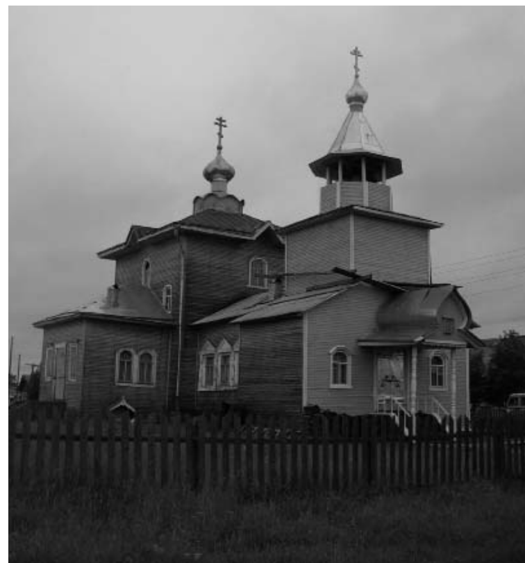
Малопинезская Спасо-Преображенская церковь. 2007 г.

хоронения преподобного Сергия продолжают происходить и в наше непростое время. У нас нет сомнения в том, что они совершались и в период с конца XVII до середины XX века, просто чудес тогда, в силу известных причин, никто не записывал, а то, что передавалось устно — со временем забывалось и не вошло в предание. Очевидно