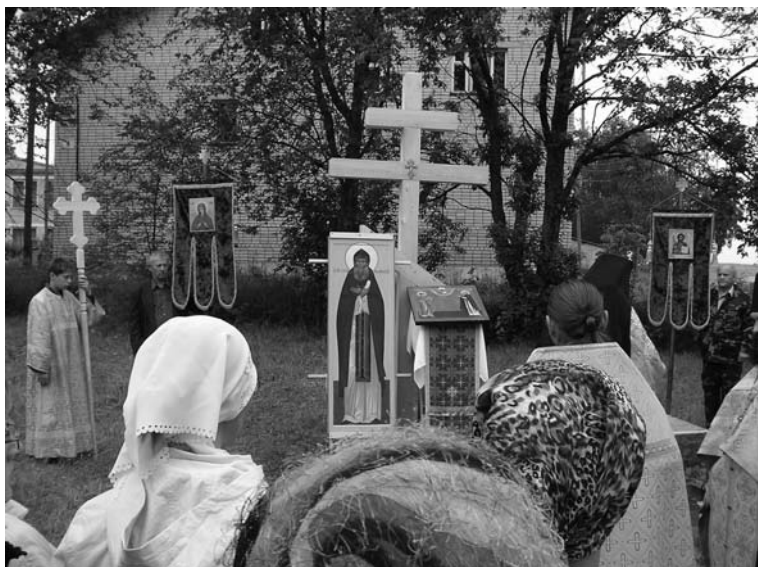
Молебен в с. Верхней Тойме у креста на месте разрушенного безбожниками Троицкого храма. 30 июня 2007 г.