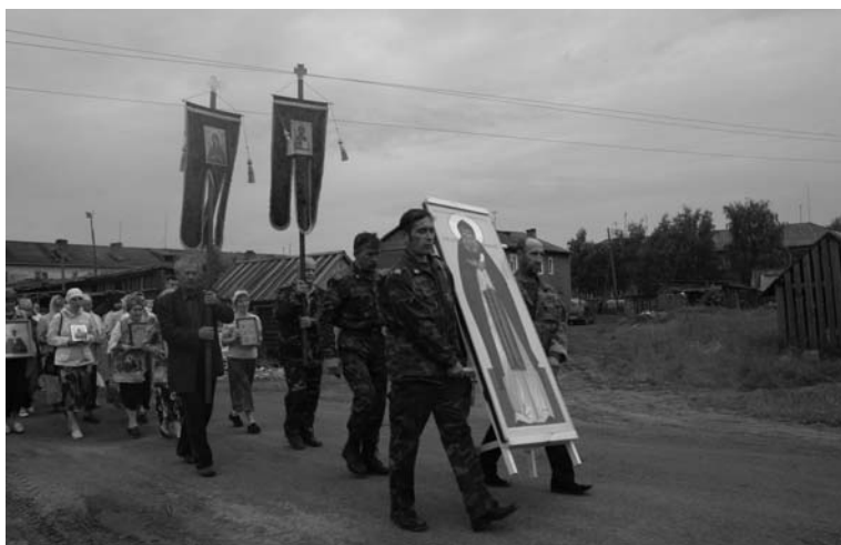
Крестный ход в Верхней Тойме. 30 июня 2007 г.