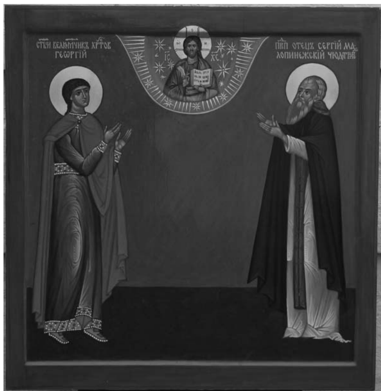
Икона Святого Великомученика Георгия и преподобного Сергия Малопинежского, написанная в г. Вологде иконописцем А.М. Зубовым в 2007 г.

одно — без чудес не было бы многочисленных паломников ко гробу святого, не было бы почитания сего Угодника Божия, и имя его не сохранилось бы в минувших веках.