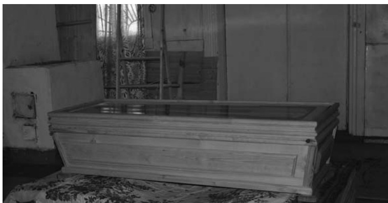
Рака прп. Сергия Малопинежского в Спасо-Преображенском храме. 2007 г.