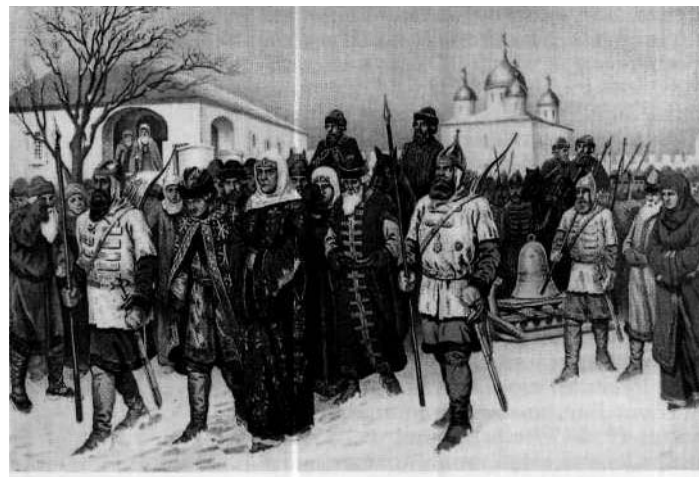
«Отправка Марфы Посадницы и вечевого колокола в Москву. 1478 г». Худ. А.Д. Кившенко

Маркиан там же и поселился вместе со своими родными — «и в той бо веси домочадцы населишася» 1 . Автор «Жития Сергия Малопинежского», по-видимому, хорошо знакомый с житиями северных святых, отмечает, что в Малой Пинежке шёл обычный процесс крестьянской колонизации края, как и во многих других местах Севера Руси: «И того Великого Новаграда сошляя люди слыша покойное место, уклоняся в ту поморскую страну и по рекам, и по обычным местам к новокрещеным людям в веси и в села ко устройению крестиянскому населялися» 2 . В Малой Пинежке Мар-