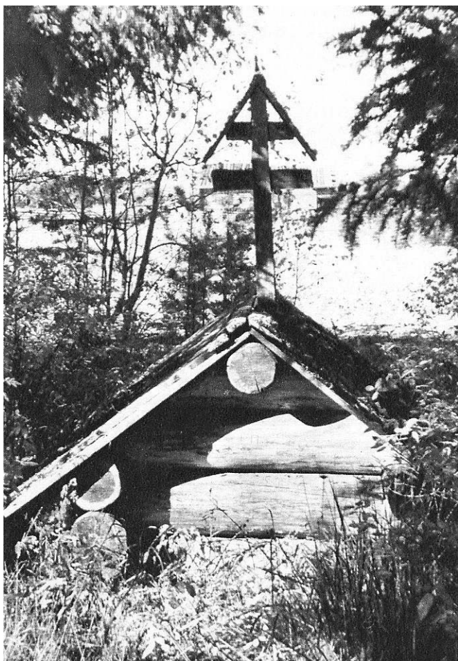
Возможно такой же «голубчик» стоял первоначально над могилой преподобного Сергия. Захоронение в с. Шалга Архангельской области.

чего не знала о Преподобном. Известно, что Феодосия пришла в Малопинежскую волость с берегов реки Северной Двины из «веси Топсы» (Топецкой волости), так как муж её был родом из Малой Пинежки. От нищенского существования («жытие же имеяше нищетно и скудно») и болезни она совсем слегла и не чаяла уже выздоровления, как оно неожиданно пришло: «и сведся в сон легок. И в тонце сне глас ей глаголющ: «О жено! Молися ты преподобному Сергию чудотворцу, что здесь на Малой Пенешки на площади в часовне под спудом почивает. И ты будеши от того недуга здрава». Исполнив повеление Преподобного, Феодосия вскоре выздоровела, но случилось так, что через некоторое время она опять тяжело заболела. И снова Сергей Малопинежский пришёл ей на помощь. В явившемся видении она увидела себя на погосте, в часовне, наполненной благоуханием и освещённой по-праздничному, в которой «преподобный Сергей чудотворец бысть почиваяй наверх земли, наверх голубчика» 1 . Он сказал ей: «О жено Феодосия! Иди скоро от дому своего на погост ко Всемилостивому Спасу и возвести священнику с причетники, чтобы по вся недели и воскресныя дни после заутрени до обедни в часовне над преподобным Сергием служили молебное пение по обычаю. А я, де, Всемилостивому