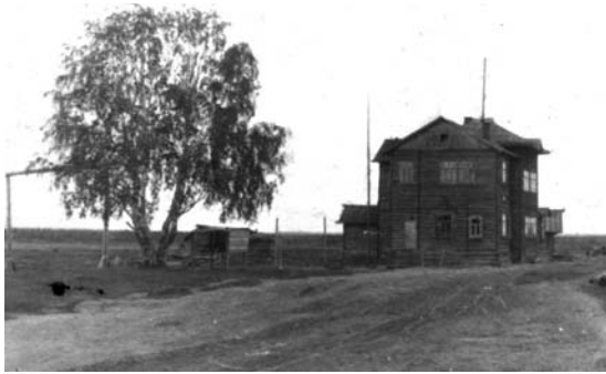
Вид на бывший Малопинежский погост. Фото 1950-х годов из фондов Верхнетоемского краеведческого музея