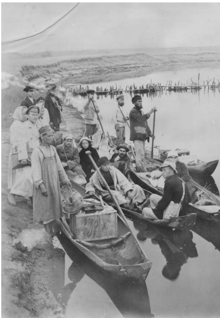
Около малопинежской деревни Волыново. 1921 г.

Комиссия осмотрела часовню, сооруженную над могилою преподобного Сергия, и произвела вскрытие и освидетельствование его мощей. До наших дней сохранился уникальный документ, подробно описывающий это мероприятие. В нем, в частности, сообщается, что «святые образы» в часовне были поставлены по церковному чиноположению «с восточную сторону», а у северной стены располагалась гробница, обколоченная с боков «выбойкой», под которой был обнаружен более ветхий «почернелой» холст. Приводится точный её размер: «изнутри она ... длиной два аршина шесть верхов, в вышину четырнадцать верхов, поперег три четверти» 1 . В акте также указано, что гробница сверху покрыта «выбойчатою» материей, на которой находится «писанный на красках» образ, обозначенный как «Преподобный Сергий Пенежский чудотворец». Размеры иконы: «в длину два аршина восемь верхов, поперег один аршин» 2 .