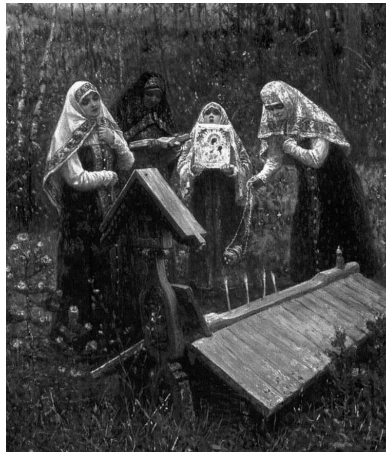
«В день поминовения». Худ. В. Рассохин

нию. После домашнего утреннего молитвенного правила Елисей, как обычно, пошел служить утреню в свою приходскую церковь. Приблизившись к ней, он с удивлением заметил, что Георгиевский храм освещён, как в праздник, полон молящегося народа, и что какой-то священник уже совершает в нём богослужение. Елисей подумал