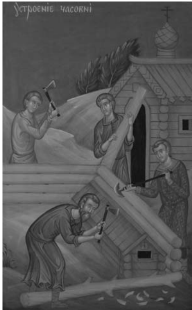
«Устроение часовни». Фрагмент житийной иконы прп. Сергия Малопинежского

священник «обещаю неложно» выполнить свой забытый обет. Вскоре сыновья Киприана пошли на поправку и выздоровели окончательно. Киприан же вместе с ними «в подобно время поскору и не замедляя», испросив благословения у своего духовного начальства, «возградиша часовню над гробом преподобнаго Сергия и поставиша образ Господа Бога и Спаса нашего Иисуса Христа и Пречистые Богородицы на поклонение приходящим и веси той живущим». Случилось это в 1649–1650 годах 1 .