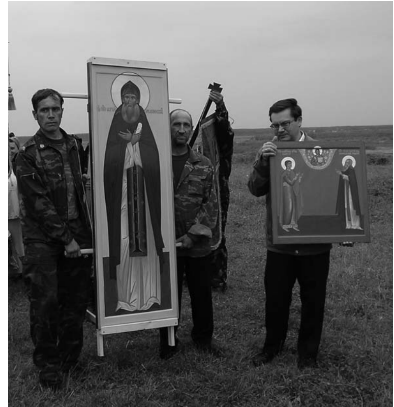
Возвращение икон прп. Сергия на Малую Пинежку. 30 июня 2007 г.