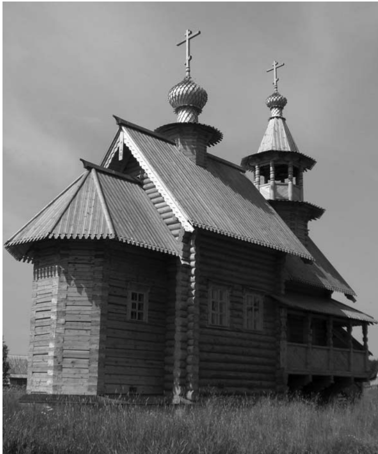
Прототип храма во имя Сергия Малопинежского в с. Верхней Тойме — церковь в Завидово Тверской области

уже не было, но сохранился кирпичный контур, на котором когда-то покоилось надгробие. И хотя стены подвала за долгие годы подверглись почти полному разрушению, (оставались только огром-