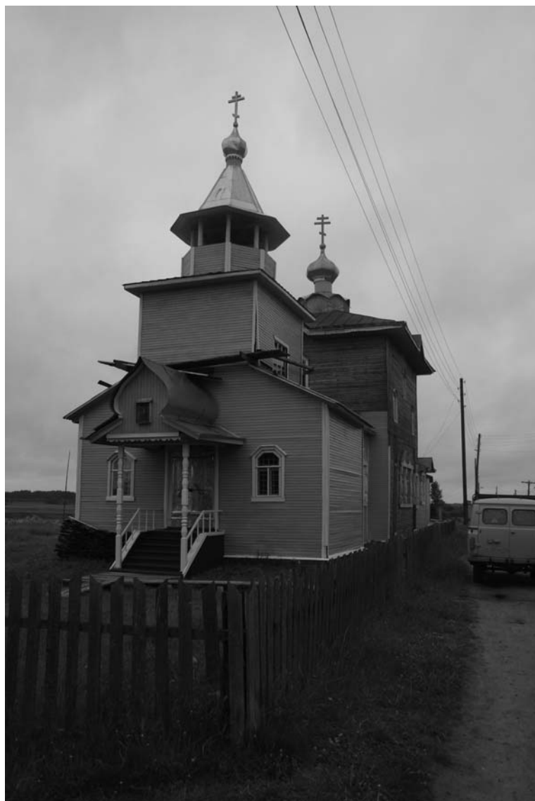
Малопинежская Спасо-Преображенская церковь. 2007 г.