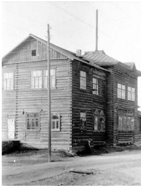
Горковская средняя школа. 1977 г.