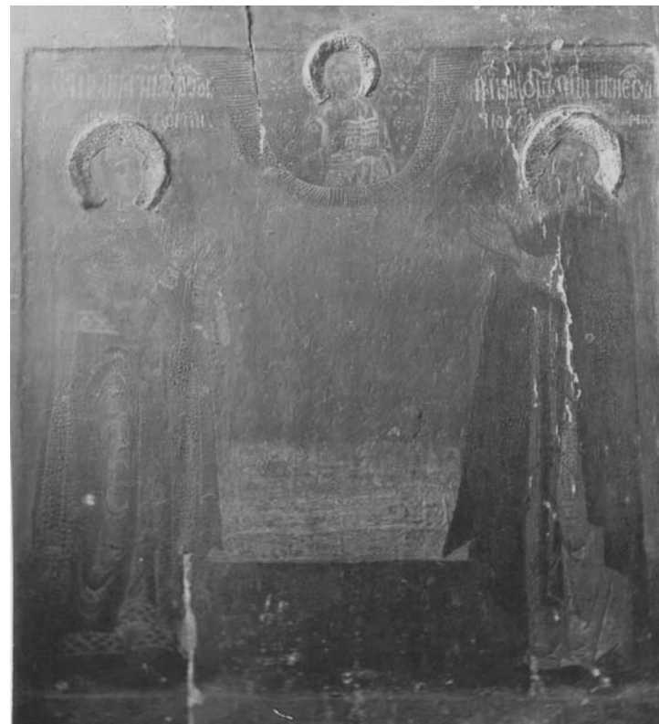
Икона «Святого Великомученика Георгия и преподобного Сергия Пинежского чудотворца» из Спасо-Преображенской церкви. 1921 г.

бесследно сгинула в беспощадном огне революционных потрясений и воинствующего атеизма 1 .