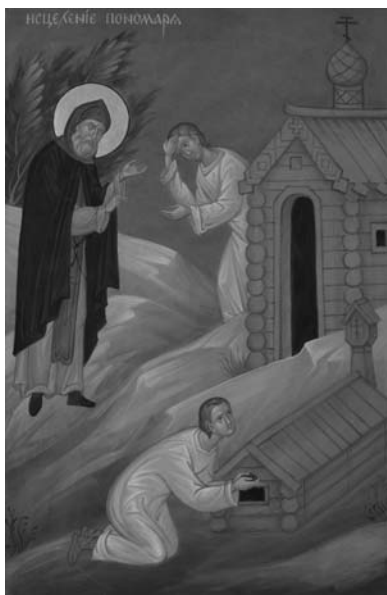
«Исцеление пономаря». Фрагмент житийной иконы прп. Сергия Малопинежского