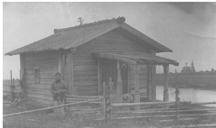
Часовня в деревне Пурьшевская с видом на Спасо-Преображенский храм. 1921 г.

около двух часов дня в Георгиевской церкви пожар из-за сильного ветра сразу же перекинулся на Преображенский храм, а с него и на часовню преподобного Сергия. Колокола расплавились, другое церковное имущество и иконы прихожанам удалось спасти. У жителей Горковской волости 1 ,