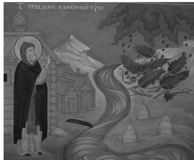
«Отведение каменной тучи». Фрагмент житийной иконы прп. Сергия Малопинежского