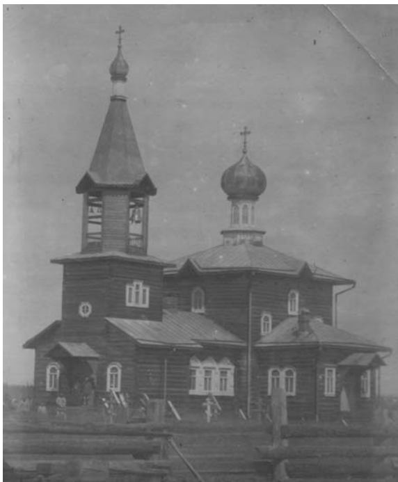
Малопинежская Спасо-Преображенская церковь. 1921 г.

снаружи 1 . Но вскоре после того, как только храмы привели в благолепный вид, случилось несчастье. 18 марта 1908 года обе находившиеся на погосте церкви вместе с часовней постройки 1649 года по невыясненной причине сгорели 2 . Начавшийся