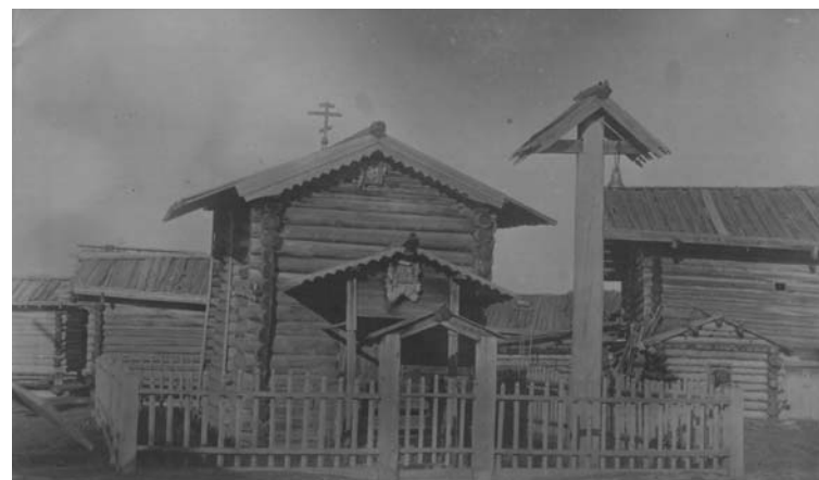
Часовня в деревне Мошканово. 1921 г.

2 ГАВО. — Ф. 496. — Оп. 1. — Д. 18716. — Л. 224 об.; там же. — Д. 18726. — Л. 230; ВЕВ. — 1908. — № 8–9. — С. 156. Здание школы было построено на средства прихожан в 1903 году. Находилось в 200 м. к западу от погоста. — Прим. авт.