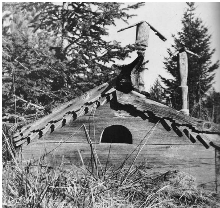
Северо-русский образец домовины «с оконцем». Захоронения в с. Ковда, республики Карелия.

вредим», хотя не было «над тем голубчиком ни покрова, ни храмины 65 лет до поставления часовни» 1 . К могиле вскоре стали стекаться многие ищущие исцеления люди, потому что Господь прославил Своего угодника даром чудотворений 2 .