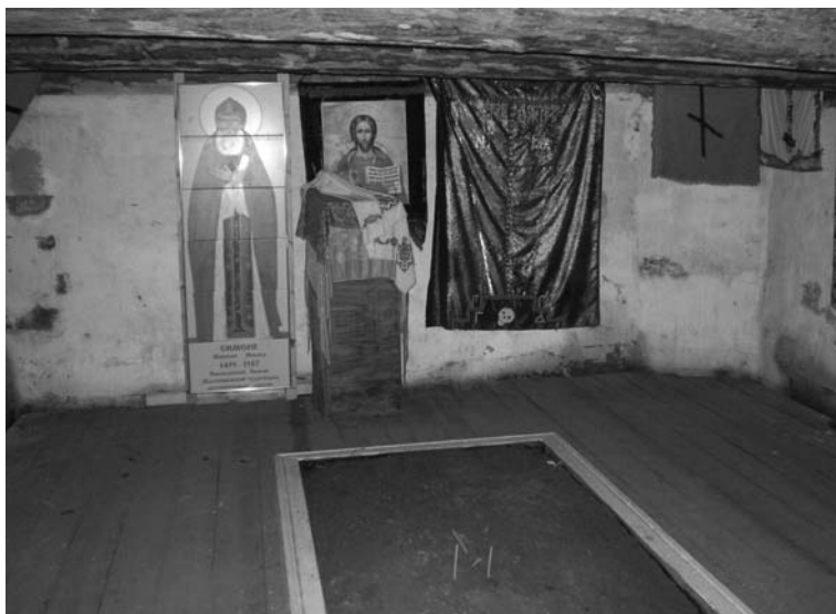
Подвальная часовня прп. Сергия Малопинежского. 2007 г.

Следует добавить, что изображение Сергия Малопинежского помещено иконописцами на одной из фресок Успенского храма, недавно воссозданного на улице Логинова в г. Архангельске.