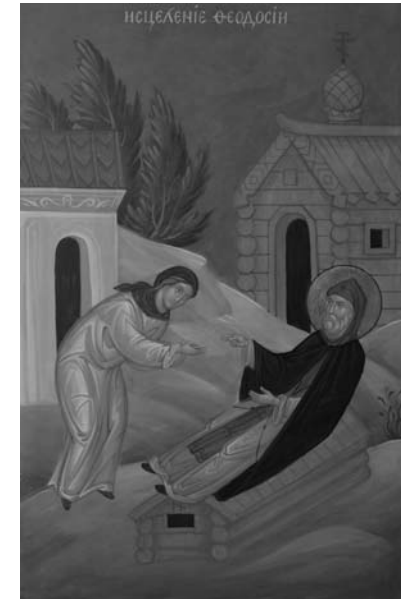
«Исцеление Феодосии». Фрагмент житийной иконы прп. Сергия Малопинежского