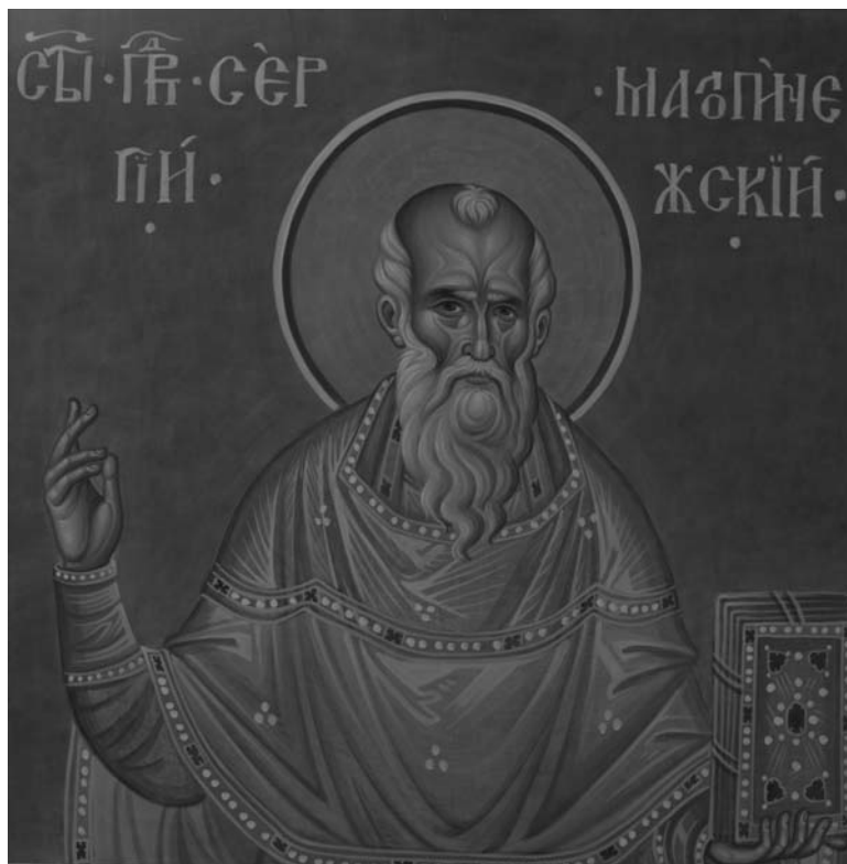
Фреска прп. Сергия Малопинежского из Успенской церкви на ул. Логинова в г. Архангельске

всего, определённые знамения, которые становятся вполне понятными в наши дни. «Уплывающий старичок», явившийся в видении в тридцатые годы — знак крайнего отступления от веры. «Огонёк в алтаре» в военные годы — первый признак её возвращения.