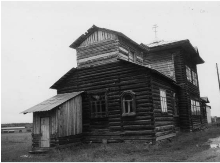
Спасо-Преображенская церковь в Горковском сельсовете. 1994 г.

тидесяти лет, вплоть до 1990 года, здание бывшей церкви находилось в ведении Горковской средней школы.