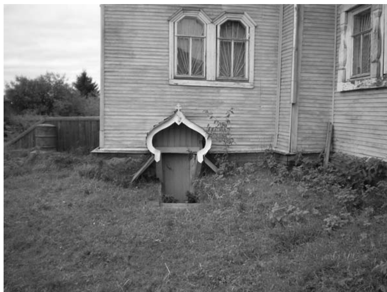
Вход в часовню прп. Сергия Малопинежского. 2007 г.

и Холмогорского Тихона установился новый праздник. День 30 июня стал для верующих отныне Днём сретения иконы преподобного Сергия Малопинежского чудотворца 1 .