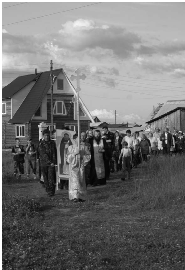
Крестный ход в Верхней Тойме. 30 июня 2007 г.