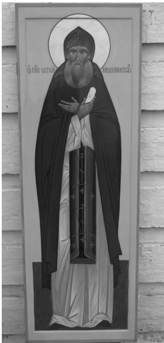
Ростовая икона преподобного Сергия Малопинежского, написанная в г. Вологде иконописцем А.М. Зубовым в 2007 г.