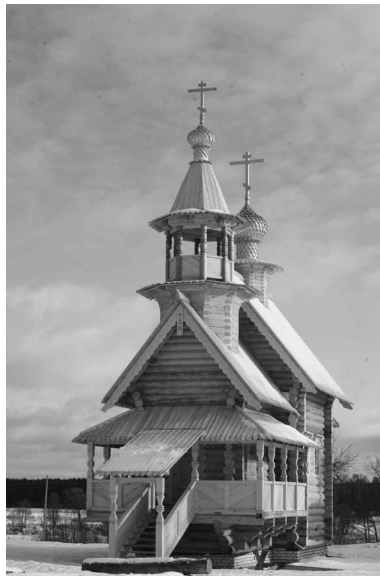
Прототип храма во имя Сергия Малопинежского в с. Верхней Тойме — церковь в Завидово Тверской области