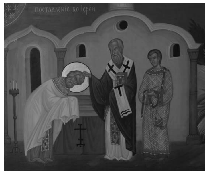
«Поставление во иереи». Фрагмент житийной иконы прп. Сергия Малопинежского