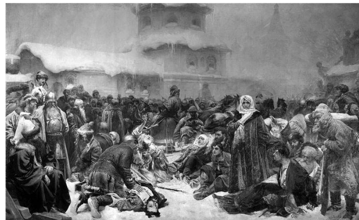
«Марфа Посадница. Уничтожение новгородского веча». Худ. К.В. Лебедев

же лета и дни Руския же земли после Чюдскаго разбежения у Студеного моря по далним рекам и по завалом с новокрещеными людьми места не изнаполнилися и не изнаселилися. А для роспаши земныя и к телесному покою пищею в тех поморских местех строино, а прилучилися рыбные ловли, и птичьи угодыя, и езера около близ жылых мест». 1 Из «Сказания о преподобном Сергии Малопинежском» И.П. Верюжского 2 , которым пользовались все последующие исследователи, не возможно было сделать определённый вывод о первоначальном месте жительства Маркиана Неклюда, как и о