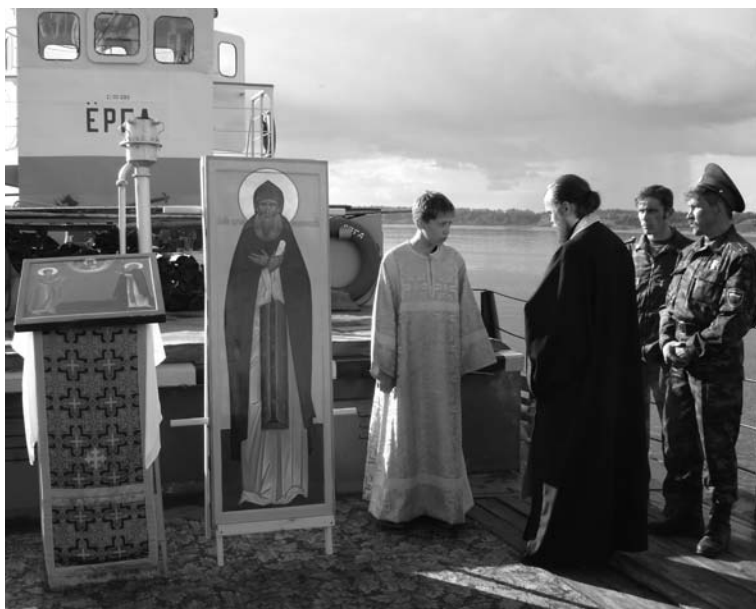
Иконы прп. Сергия Малопинежского на теплоходе «Ёрга». 29 июня 2007 г.