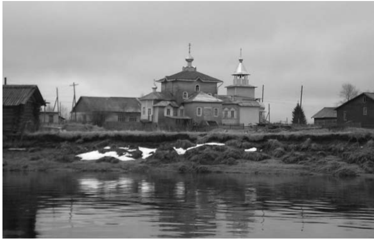
Вид на Спасо-Преображенский храм с реки Пинеги. Весна 2009 г.

Будучи церковнослужителем Малопинезского прихода, автор «Жития...» по какой-то причине скрывает своё имя. Сообщает только, что однажды «окаянный и многогрешный некто церковный клирик веси тоя Боголепнаго Преображения», убедившись, что никто до него ничего не писал о Сергии Малопинезском «распытав, и услышах, и уведах известно, яко никтоже нигдеже не написавше о жытии и о чудесех его», решил исправить такую несправедливость — «како таковая преславная чудеса угодником Христовым преподобным Сергием творятся, а пребыша без написания».