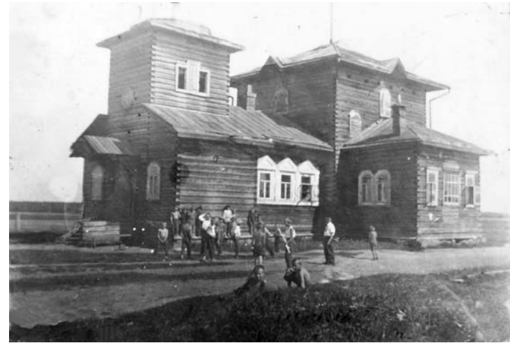
«Межколхозный пионерский лагерь» на базе бывшей Малопинейской церкви. 1938—1939 годы.