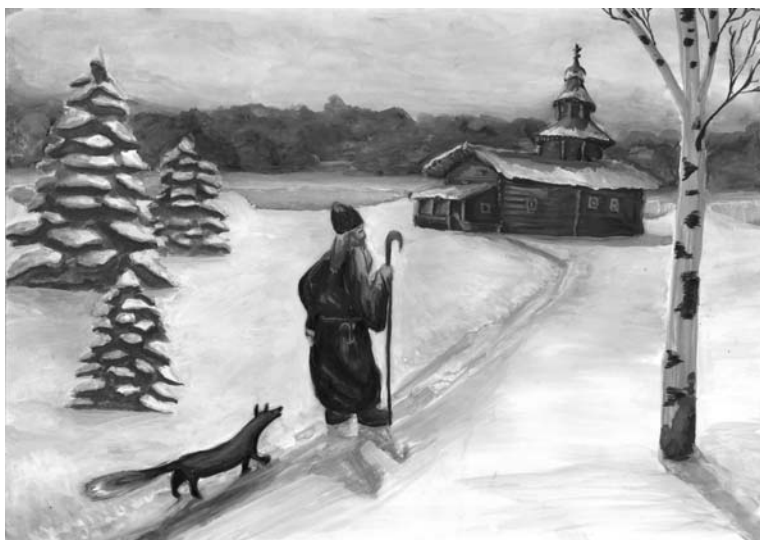
«Малопинежский пресвитер Симеон и Лись». Худ. Е.В. Копыткова

Фрагмент синодальной писарской копии «Жития преподобного Сергия Малопинежского». 1739 г.