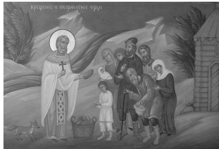
«Крещение и окормление чуди». Фрагмент житийной иконы прп. Сергия Малопинежского

висел и от личных качеств и добродетелей самого пресвитера Симеона, его радушного и ласкового со всеми обращения, неустанной настойчивости, долготерпения и любви: «в мире живый благочестно, Престолу Владыце священнодействовав, житейское море волну в безмолвии преплавая, имея душу милостиву и чист помысл, сердце бодро, молчание и кротость смиrenomудрену, и любовь воистину нелицемерну» 1 .