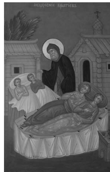
«Исцеление братцев». Фрагмент житийной иконы прп. Сергия Малопинежского