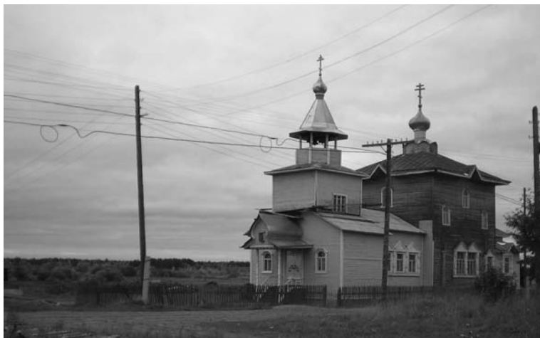
Малопинежская Преображенская церковь. 2008 г.