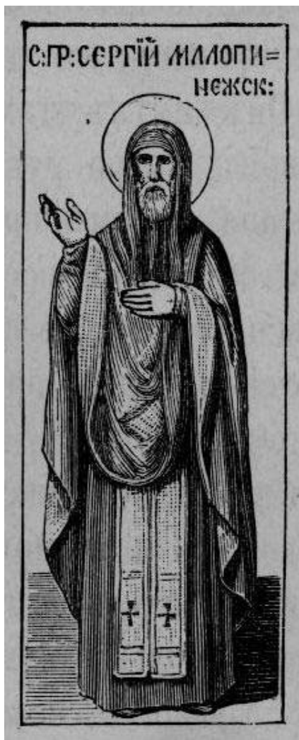
Изображение прп. Сергия Малопинежского. 1892 г. Иллюстрация для книги «Жития святых...» архиепископа Филарета (Гумилевского), выполненная академиком Ф.Г. Солнцевым

В 1880 году в Вологде издаются «Исторические сказания о жизни святых, подвизавшихся в Вологодской епархии, прославляемых всею церковью и местночтимых», составленные преподавателем Вологодского духовного училища протоиереем Иоанном Петровичем Верюжским 1 . В этом труде дано более полное, развернутое повествование о преподобном Сергии, со ссылками на старинную рукопись и другие исторические материалы, известные в то время автору.