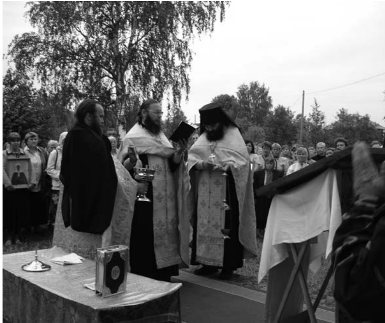
Молебен в с. Верхней Тойме у креста на месте разрушенного безбожниками Троицкого храма. 30 июня 2007 г.