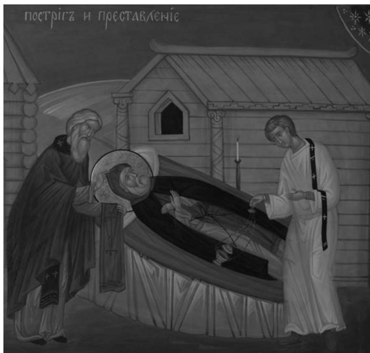
«Повтригъ и преставленіе».

Фрагмент житийной иконы прп. Сергия Малопинежского