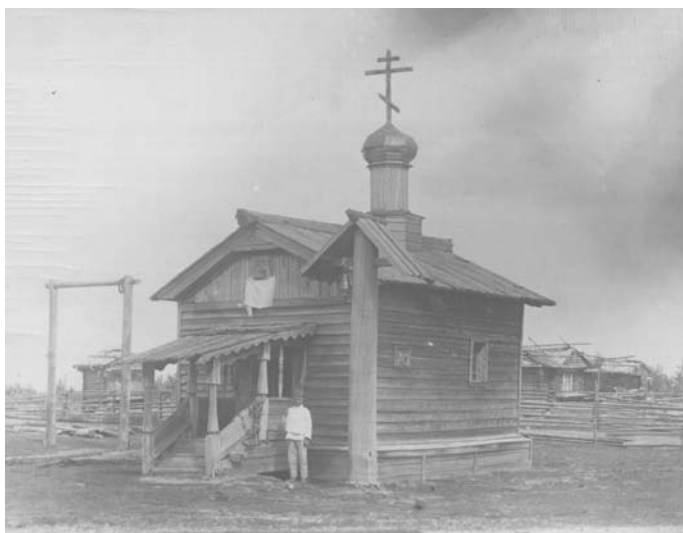
Часовня в деревне Волыново. 1921 г.

которая слыла одной из беднейших в Сольвычегодском уезде Вологодской губернии, средств достаточных для строительства нового храма сразу не нашлось. С разрешения епархиального начальства под церковь временно было приспособлено здание церковно-приходской школы 1 , к которому по этому случаю был пристроен алтарь 2 .